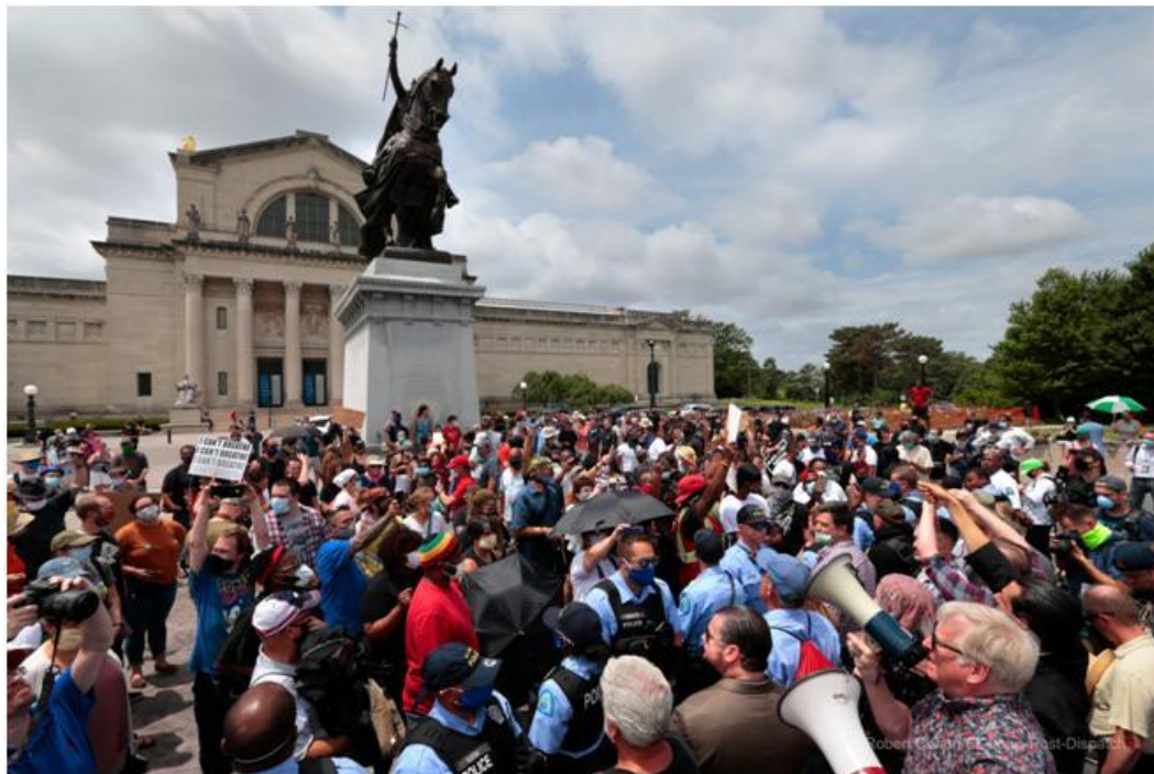
Giáo dân Công Giáo ngăn chặn đám biểu tình tả phái đòi gặt sập tượng St. Louis ở Missouri.