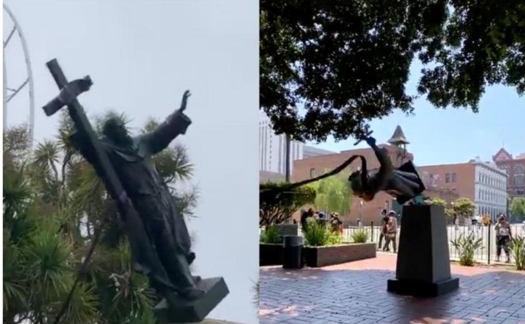
Nhóm biểu tình triệt hạ 2 tượng Thánh Junipero Serra ở California ngày 4-7-2020